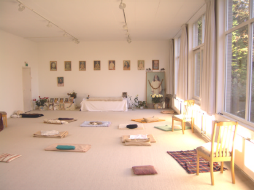
De meditatiezaal in Sterksel