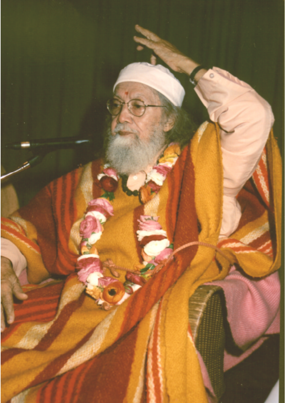
Paramahansa Hariharanandaji onderwijst de Kriya Yoga techniek