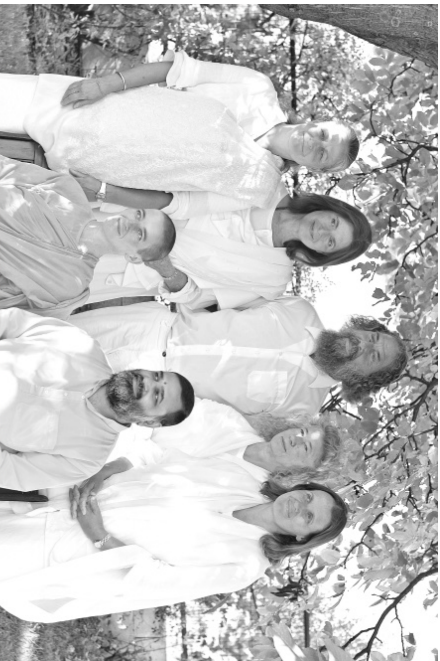
De yogacharya's voor Europa