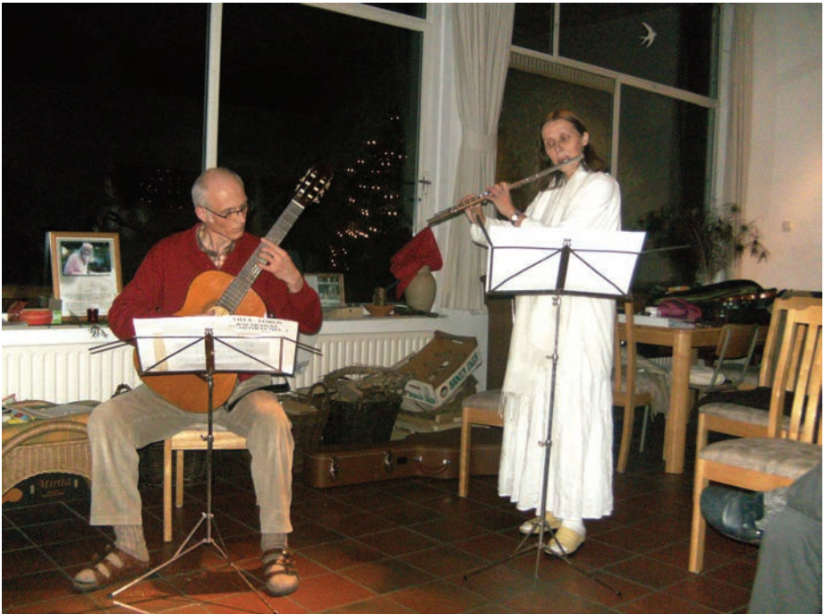
Zur Neujahrsfeier 2009/2010 in Sterksel

A uf der Internetseite des Kriya Yoga Zentrums kann man unter 'News' auf der Eröffnungsseite oben links neben aktuellen Programmen in den Niederlanden auch die Informationen aller Kriya Yoga Programme in Europa abrufen. 2010 gibt es 72 Programme in 15 Ländern - Österreich, Schweiz, Deutschland, Frankreich, England, Ungarn, Irland, Island, Lettland, Niederlande, Portugal, Polen, Rumänien, Schweden und Spanien. Die Website lautet: www.kriyayoga-meditatie.nl