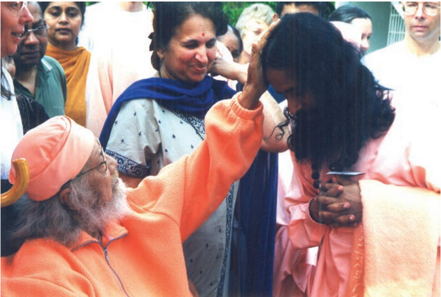
Segnungen des Meisters