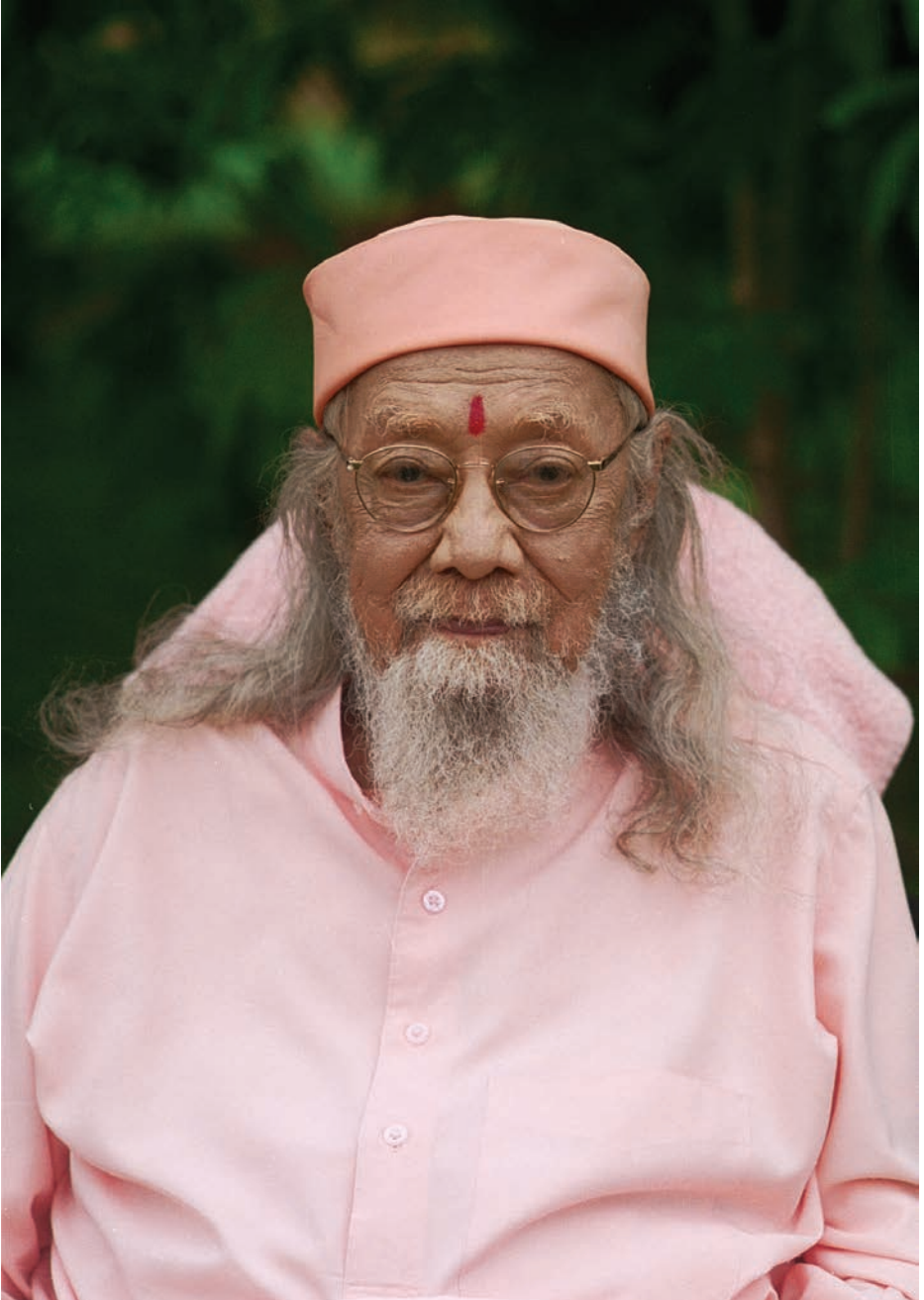
Paramahansa Baba Hariharanandaji im Garten von Homestead