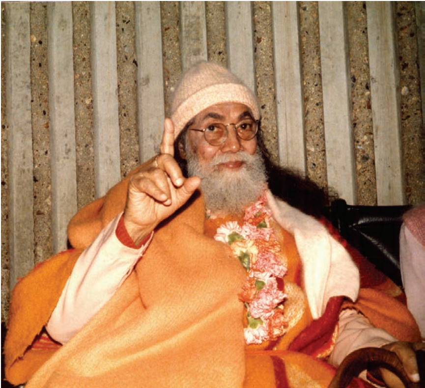
Swami Hariharananda Giri 1984 in Frankreich