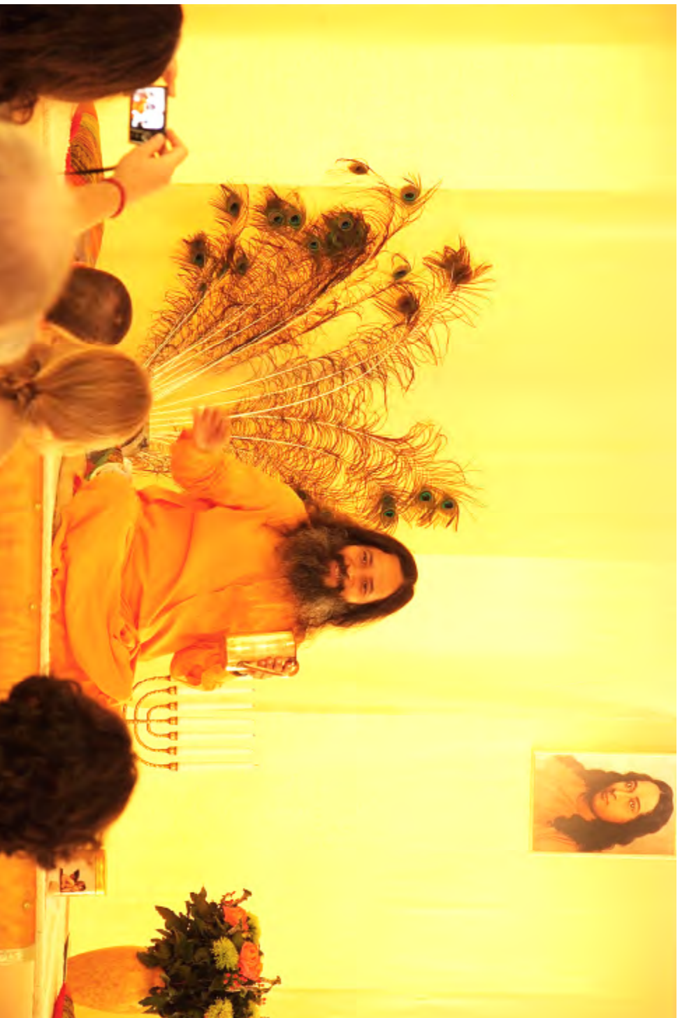
Paramahansa Prajnanananda tijdens een lezing 2011 in Sterksel