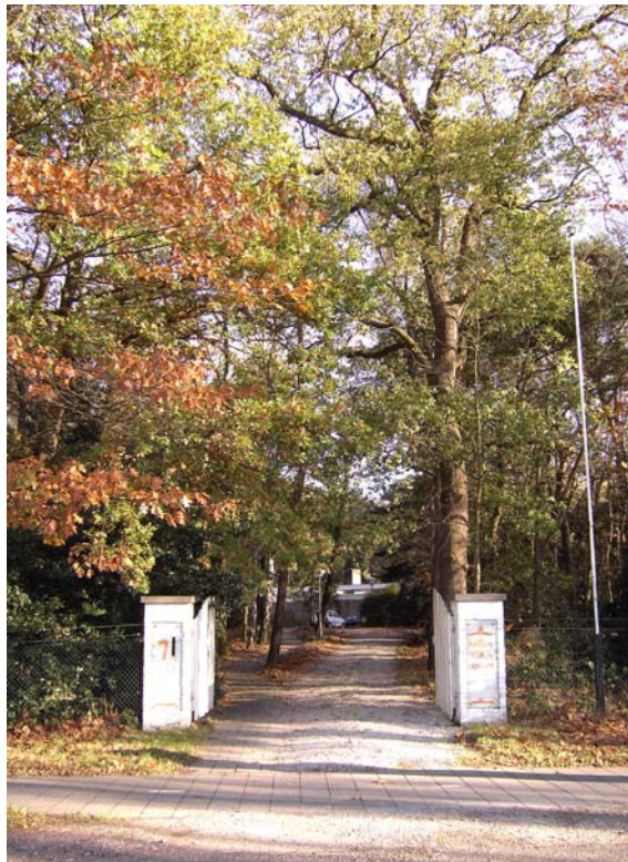
De oprit naar het Kriya Yoga Centrum in Sterksel

De website luidt: www.kriyayoga-meditatie.nl