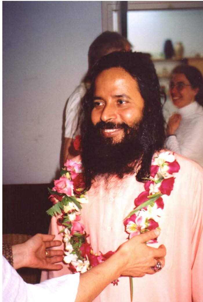
Paramahansa Prajnanananda tijdens het zomer programma 2005

boeken over meditatie en spiritualiteit te publiceren. Ook heeft hij diverse gezondheidscentra in India opgezet en daar een internaat voor kinderen uit zeer arme gezinnen gesticht. Hij is de motor achter een groot aantal Centenary activiteiten, waaronder de publicatie van de verzamelde werken van Paramahansa Hariharananda.