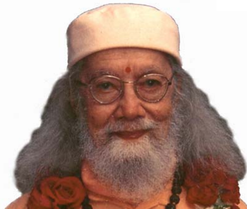
Swami Hariharananda Giri in Sterksel. zomer 1993

De beoefening van kriya yoga resulteert in een gelijktijdige ontwikkeling van lichaam, geest en ziel, in de kortst mogelijke tijd. Het is een eenvoudig maar vitaliserend proces. Iedereen kan zich door kriya yoga in zijn eigen richting verder ontwikkelen. Het is een levend en vernieuwend spiritueel pad dat zich steeds weer aanpast aan de vitaliteit van de mens, niet alleen in ieders individueel leven, maar in het leven van de gehele mensheid.