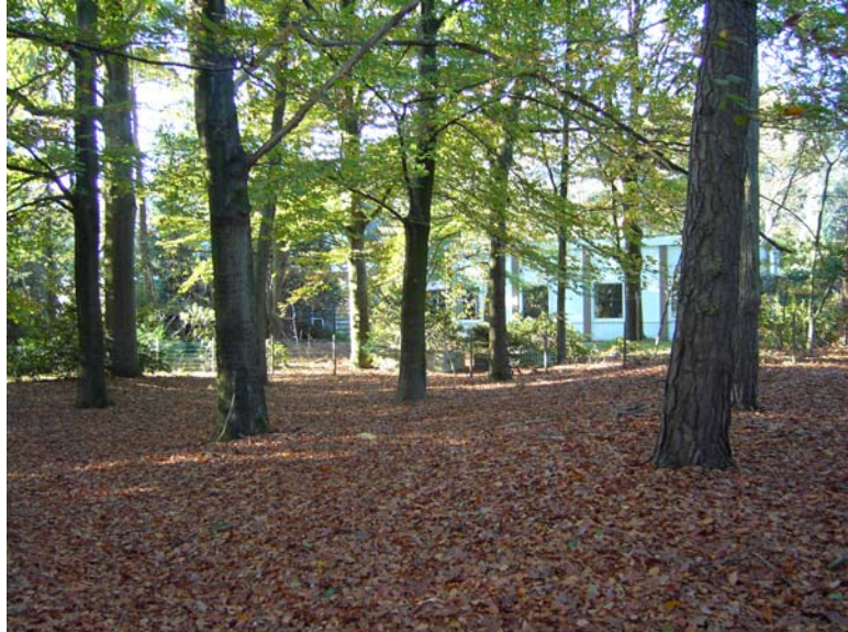
Het bos van het Kriya Yoga Centrum