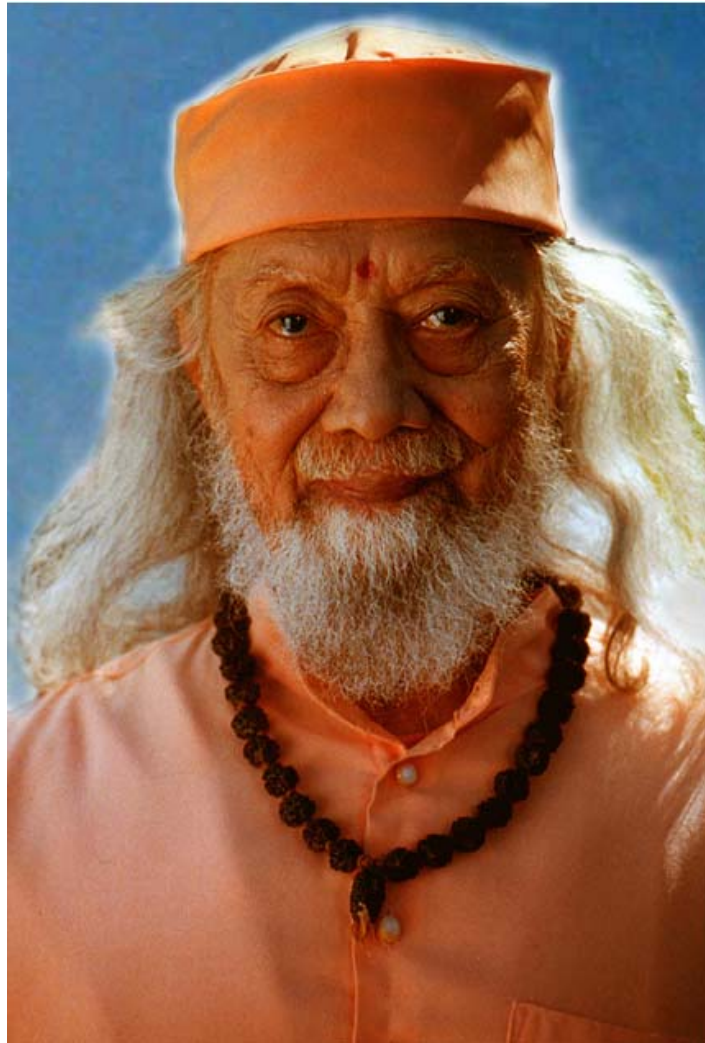
Gurudev Baba Hariharanandaji

Op deze dag zullen speciale activiteiten plaatsvinden met om 17.00 uur een feestelijke bijeenkomst.