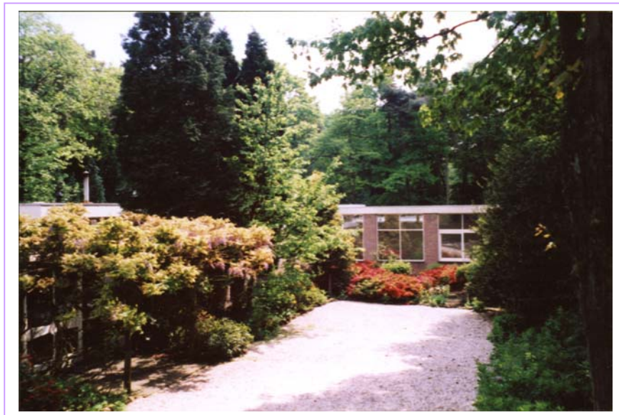
Het Kriya Yoga Centrum in Sterksel

We zien er naar uit om Baba Hariharanandaji's 100ste verjaardag te vieren op 6 augustus 2006 en zijn er zeker van dat het net zo'n bijzonder evenement zal worden als de inwijding van deze mooie ashram, 13 jaar geleden!