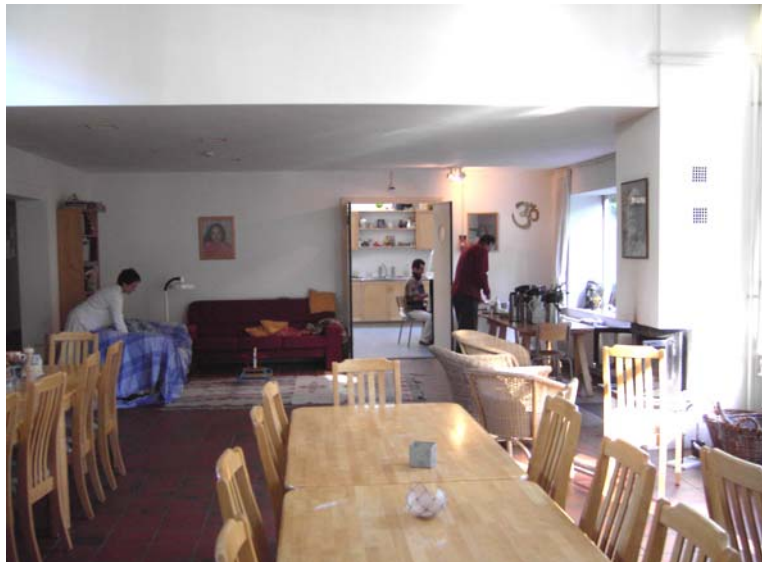
De eetzaal van het Kriya Yoga Centrum